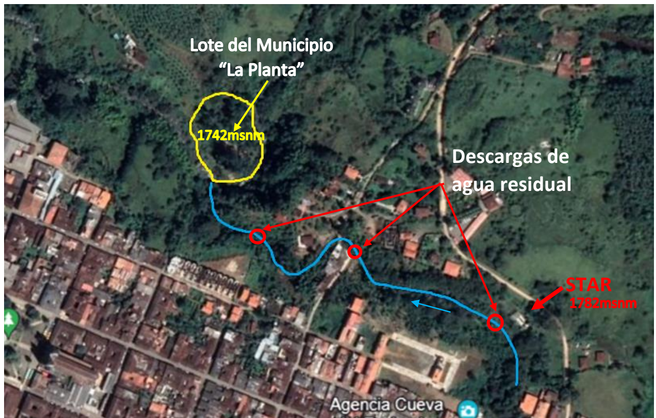
Figura 2. Ubicación de los vertimientos y lote del municipio.

Para llevar a cabo esta propuesta se podría trazar un colector paralelo a la fuente desde la entrada de la STAR existente en la cota 1782 msnm, hasta el lote del municipio en la cota 1742 msnm, con una diferencia en la elevación de 40 metros, suficientes para llevar el agua por gravedad.