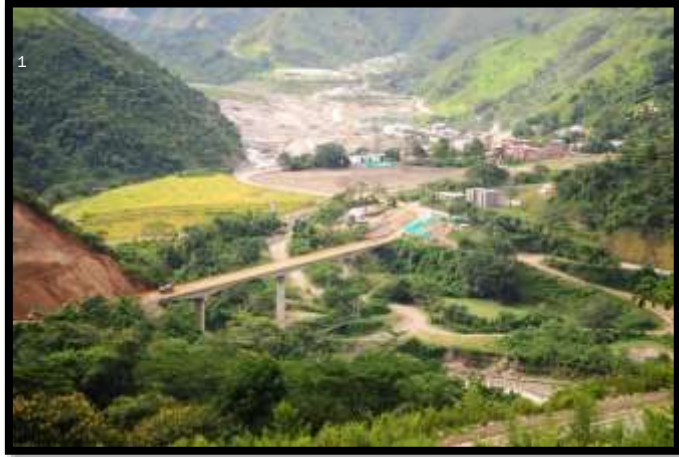
Imagen 1. Panorámica del municipio de Toledo

El esquema de conectividad ecosistémica se deriva de un análisis regional del territorio a escala departamental, presentando una red de conectividades ecosistémicas como conjunto de probabilidades de movilidad de la biodiversidad a través de distintas rutas, que pueden o no coincidir con espacios naturales o antrópicos, que soportan el ordenamiento territorial en términos de oferta y demanda de bienes y servicios ecosistémicos para la población.