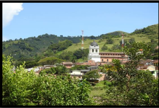
Imagen 1. Panorámicas del municipio de Titiribí

El esquema de conectividad ecosistémica se deriva de un análisis regional del territorio a escala departamental, presentando una red de conectividades ecosistémicas como conjunto de probabilidades de movilidad de la biodiversidad a través de distintas rutas, que pueden o no coincidir con espacios naturales o antrópicos, que soportan el ordenamiento territorial en términos de oferta y demanda de bienes y servicios ecosistémicos para la población.