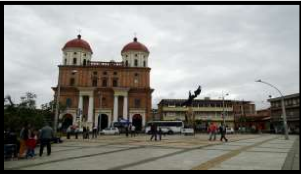
Imagen 1. Panorámica del municipio de Santa Rosa de Osos

El esquema de conectividad ecosistémica se deriva de un análisis regional del territorio a escala departamental, presentando una red de conectividades ecosistémicas como conjunto de probabilidades de movilidad de la biodiversidad a través de distintas rutas, que pueden o no coincidir con espacios naturales o antrópicos, que soportan el ordenamiento territorial en términos de oferta y demanda de bienes y servicios ecosistémicos para la población.