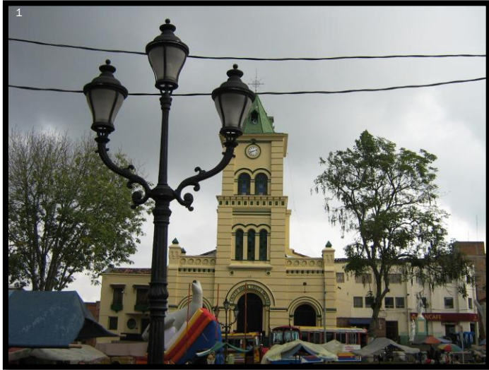
Imagen 1. Panorámica del municipio de Santa Bárbara

El esquema de conectividad ecosistémica se deriva de un análisis regional del territorio a escala departamental, presentando una red de conectividades ecosistémicas como conjunto de probabilidades de movilidad de la biodiversidad a través de distintas rutas, que pueden o no coincidir con espacios naturales o antrópicos, que soportan el ordenamiento territorial en términos de oferta y demanda de bienes y servicios ecosistémicos para la población.