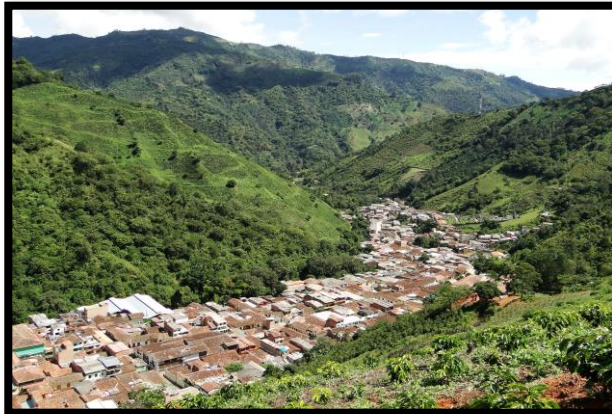
Imagen 1. Panorámicas del municipio de Salgar

El esquema de conectividad ecosistémica se deriva de un análisis regional del territorio a escala departamental, presentando una red de conectividades ecosistémicas como conjunto de probabilidades de movilidad de la biodiversidad a través de distintas rutas, que pueden o no coincidir con espacios naturales o antrópicos, que soportan el ordenamiento territorial en términos de oferta y demanda de bienes y servicios ecosistémicos para la población.