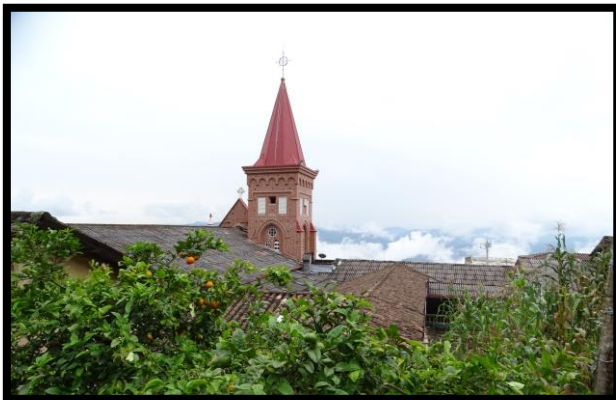
Imagen 1. Panorámica del municipio de Montebello

El esquema de conectividad ecosistémica se deriva de un análisis regional del territorio a escala departamental, presentando una red de conectividades ecosistémicas como conjunto de probabilidades de movilidad de la biodiversidad a través de distintas rutas, que pueden o no coincidir con espacios naturales o antrópicos, que soportan el ordenamiento territorial en términos de oferta y demanda de bienes y servicios ecosistémicos para la población.