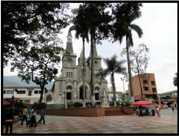
Imagen 1. Panorámicas del municipio de La Estrella

El esquema de conectividad ecosistémica se deriva de un análisis regional del territorio a escala departamental, presentando una red de conectividades ecosistémicas como conjunto de probabilidades de movilidad de la biodiversidad a través de distintas rutas, que pueden o no coincidir con espacios naturales o antrópicos, que soportan el ordenamiento territorial en términos de oferta y demanda de bienes y servicios ecosistémicos para la población.