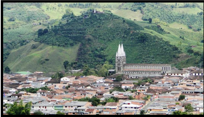
Imagen 1. Panorámicas del municipio de Jardín

El esquema de conectividad ecosistémica se deriva de un análisis regional del territorio a escala departamental, presentando una red de conectividades ecosistémicas como conjunto de probabilidades de movilidad de la biodiversidad a través de distintas rutas, que pueden o no coincidir con espacios naturales o antrópicos, que soportan el ordenamiento territorial en términos de oferta y demanda de bienes y servicios ecosistémicos para la población.