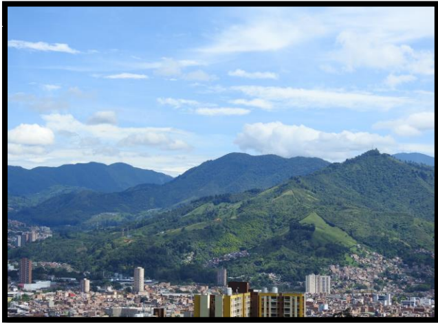
Imagen 1. Panorámicas del municipio de Itagüí

Este instrumento va a tener coincidencias con los determinantes ambientales definidos en la norma para tal que hacen parte de la estructura ecológica local, por tanto, va a coexistir desde lo espacial en el territorio con suelos con restricciones y condicionamientos a su uso determinado en ordenamiento territorial, se debe entender en términos de gestión para la biodiversidad como insumo en el ordenamiento ambiental territorial y sus servicios ecosistémicos. En este orden de ideas este instrumento diferencia los tipos de restricciones del suelo de acuerdo a los niveles definidos en la Ley 388 de 1997, donde prevalece lo ya tomado como determinante ambiental desde lo local hacia lo regional presentes del medio natural, transformados, gestión del riesgo y cambio climático y relaciones con densidades de ocupación del suelo, comportándose como articulador del territorio y a su vez orientador de los modelos de ocupación territorial propendiendo por la sostenibilidad ambiental.