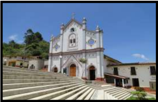
Imagen 1. Panorámica del municipio de Guadalupe

El esquema de conectividad ecosistémica se deriva de un análisis regional del territorio a escala departamental, presentando una red de conectividades ecosistémicas como conjunto de probabilidades de movilidad de la biodiversidad a través de distintas rutas, que pueden o no coincidir con espacios naturales o antrópicos, que soportan el ordenamiento territorial en términos de oferta y demanda de bienes y servicios ecosistémicos para la población.