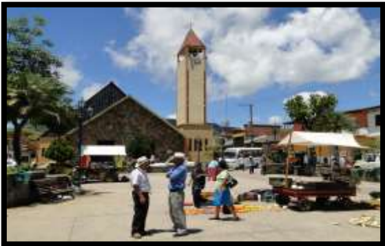
Imagen 1. Panorámica del municipio de Gómez Plata

El esquema de conectividad ecosistémica se deriva de un análisis regional del territorio a escala departamental, presentando una red de conectividades ecosistémicas como conjunto de probabilidades de movilidad de la biodiversidad a través de distintas rutas, que pueden o no coincidir con espacios naturales o antrópicos, que soportan el ordenamiento territorial en términos de oferta y demanda de bienes y servicios ecosistémicos para la población.