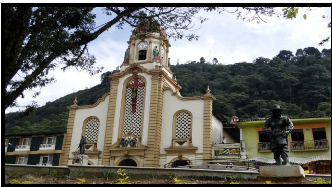
Imagen 1. Panorámica del municipio de Fredonia

El esquema de conectividad ecosistémica se deriva de un análisis regional del territorio a escala departamental, presentando una red de conectividades ecosistémicas como conjunto de probabilidades de movilidad de la biodiversidad a través de distintas rutas, que pueden o no coincidir con espacios naturales o antrópicos, que soportan el ordenamiento territorial en términos de oferta y demanda de bienes y servicios ecosistémicos para la población.