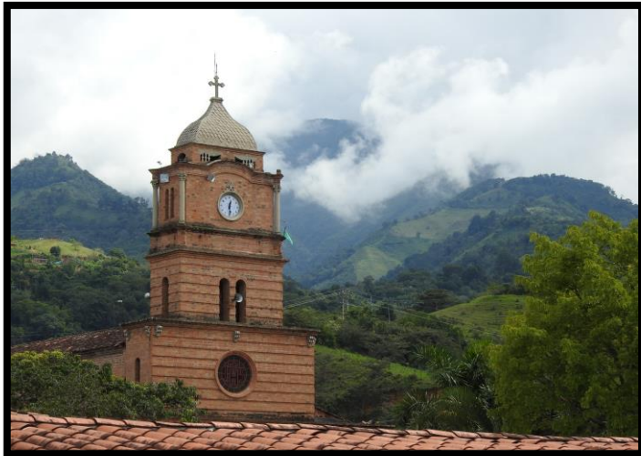
Imagen 1. Panorámica del municipio de Ebéjico

Este instrumento va a tener coincidencias con los determinantes ambientales definidos en la norma para tal que hacen parte de la estructura ecológica local, por tanto, va a coexistir desde lo espacial en el territorio con suelos con restricciones y condicionamientos a su uso determinado en ordenamiento territorial, se debe entender en términos de gestión para la biodiversidad como insumo en el ordenamiento ambiental territorial y sus servicios ecosistémicos. En este orden de ideas este instrumento diferencia los tipos de restricciones del suelo de acuerdo a los niveles definidos en la Ley 388 de 1997, donde prevalece lo ya tomado como determinante ambiental desde lo local hacia lo regional presentes del medio natural, transformados, gestión del riesgo y cambio climático y relaciones con densidades de ocupación del suelo, comportándose como articulador del territorio y a su vez orientador de los modelos de ocupación territorial propendiendo por la sostenibilidad ambiental.