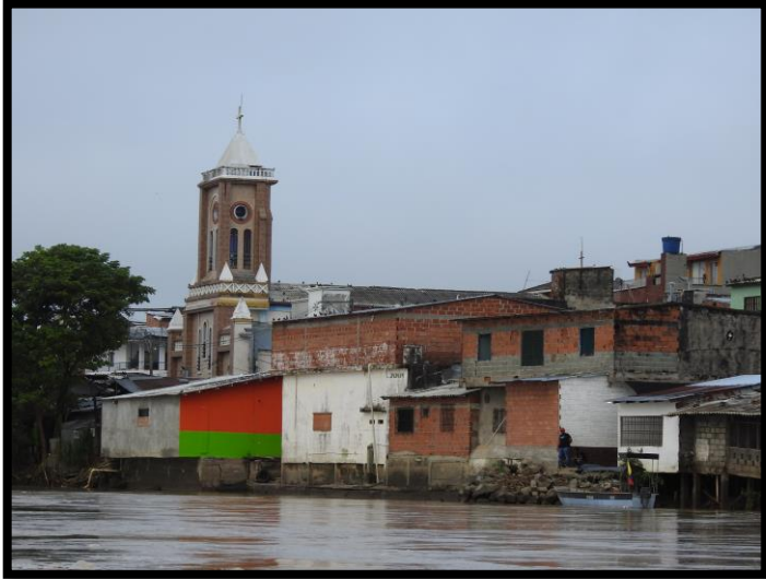
Imagen 1. Panorámicas del municipio de Caucasia

El esquema de conectividad ecosistémica se deriva de un análisis regional del territorio a escala departamental, presentando una red de conectividades ecosistémicas como conjunto de probabilidades de movilidad de la biodiversidad a través de distintas rutas, que pueden o no coincidir con espacios naturales o antrópicos, que soportan el ordenamiento territorial en términos de oferta y demanda de bienes y servicios ecosistémicos para la población.