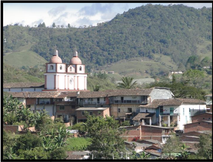
Imagen 1. Panorámicas del municipio de Carolina del Príncipe

El esquema de conectividad ecosistémica se deriva de un análisis regional del territorio a escala departamental, presentando una red de conectividades ecosistémicas como conjunto de probabilidades de movilidad de la biodiversidad a través de distintas rutas, que pueden o no coincidir con espacios naturales o antrópicos, que soportan el ordenamiento territorial en términos de oferta y demanda de bienes y servicios ecosistémicos para la población.