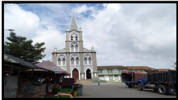
Imagen 1. Panorámica del municipio de Caramanta

El esquema de conectividad ecosistémica se deriva de un análisis regional del territorio a escala departamental, presentando una red de conectividades ecosistémicas como conjunto de probabilidades de movilidad de la biodiversidad a través de distintas rutas, que pueden o no coincidir con espacios naturales o antrópicos, que soportan el ordenamiento territorial en términos de oferta y demanda de bienes y servicios ecosistémicos para la población.