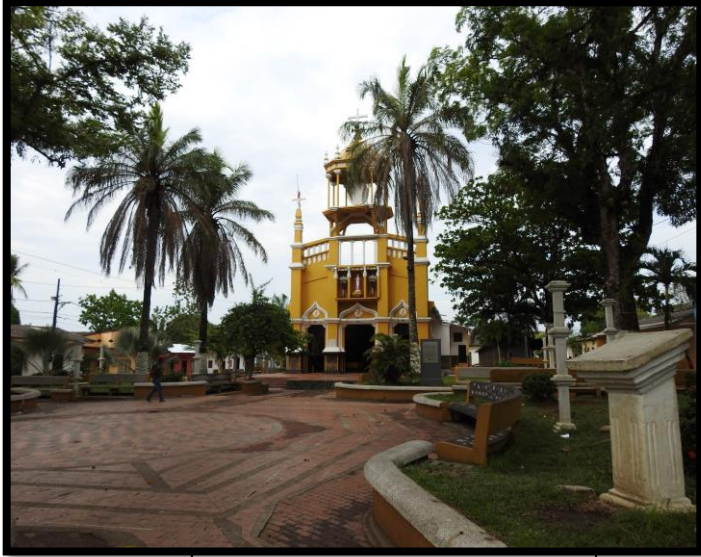
Imagen 1. Panorámicas del municipio de Cáceres

El esquema de conectividad ecosistémica se deriva de un análisis regional del territorio a escala departamental, presentando una red de conectividades ecosistémicas como conjunto de probabilidades de movilidad de la biodiversidad a través de distintas rutas, que pueden o no coincidir con espacios naturales o antrópicos, que soportan el ordenamiento territorial en términos de oferta y demanda de bienes y servicios ecosistémicos para la población.