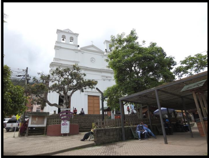
Imagen 1. Panorámica del municipio de Buriticá

El esquema de conectividad ecosistémica se deriva de un análisis regional del territorio a escala departamental, presentando una red de conectividades ecosistémicas como conjunto de probabilidades de movilidad de la biodiversidad a través de distintas rutas, que pueden o no coincidir con espacios naturales o antrópicos, que soportan el ordenamiento territorial en términos de oferta y demanda de bienes y servicios ecosistémicos para la población.