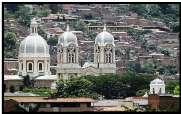
Imagen 1. Panorámicas del municipio de Bello

El esquema de conectividad ecosistémica se deriva de un análisis regional del territorio a escala departamental, presentando una red de conectividades ecosistémicas como conjunto de probabilidades de movilidad de la biodiversidad a través de distintas rutas, que pueden o no coincidir con espacios naturales o antrópicos, que soportan el ordenamiento territorial en términos de oferta y demanda de bienes y servicios ecosistémicos para la población.