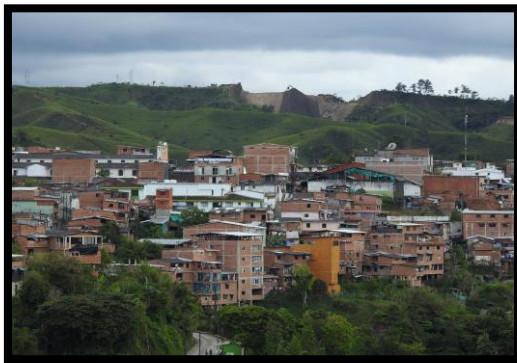
Imagen 1. Panorámica del municipio de Anorí

El esquema de conectividad ecosistémica se deriva de un análisis regional del territorio a escala departamental, presentando una red de conectividades ecosistémicas como conjunto de probabilidades de movilidad de la biodiversidad a través de distintas rutas, que pueden o no coincidir con espacios naturales o antrópicos, que soportan el ordenamiento territorial en términos de oferta y demanda de bienes y servicios ecosistémicos para la población.