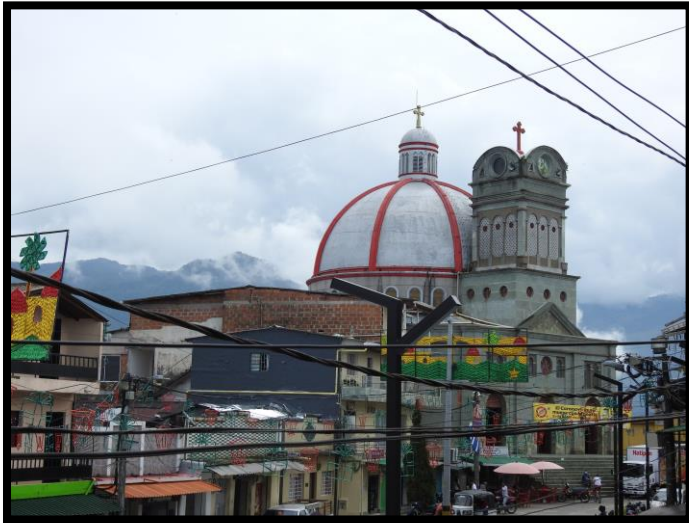
Imagen 1. Panorámica del municipio de Valdivia

El esquema de conectividad ecosistémica se deriva de un análisis regional del territorio a escala departamental, presentando una red de conectividades ecosistémicas como conjunto de probabilidades de movilidad de la biodiversidad a través de distintas rutas, que pueden o no coincidir con espacios naturales o antrópicos, que soportan el ordenamiento territorial en términos de oferta y demanda de bienes y servicios ecosistémicos para la población.