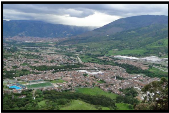
Imagen 1. Panorámicas del municipio de Girardota

El esquema de conectividad ecosistémica se deriva de un análisis regional del territorio a escala departamental, presentando una red de conectividades ecosistémicas como conjunto de probabilidades de movilidad de la biodiversidad a través de distintas rutas, que pueden o no coincidir con espacios naturales o antrópicos, que soportan el ordenamiento territorial en términos de oferta y demanda de bienes y servicios ecosistémicos para la población.