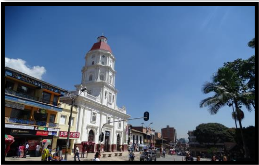
Imagen 1. Panorámicas del municipio de Caldas

El esquema de conectividad ecosistémica se deriva de un análisis regional del territorio a escala departamental, presentando una red de conectividades ecosistémicas como conjunto de probabilidades de movilidad de la biodiversidad a través de distintas rutas, que pueden o no coincidir con espacios naturales o antrópicos, que soportan el ordenamiento territorial en términos de oferta y demanda de bienes y servicios ecosistémicos para la población.