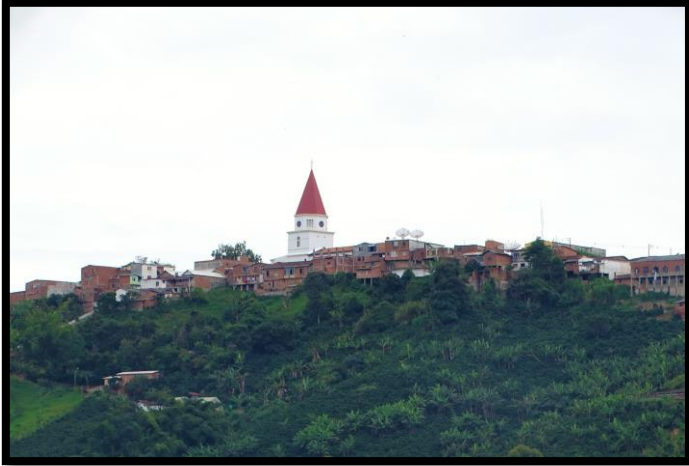
Imagen 1. Panorámicas del municipio de Armenia

El esquema de conectividad ecosistémica se deriva de un análisis regional del territorio a escala departamental, presentando una red de conectividades ecosistémicas como conjunto de probabilidades de movilidad de la biodiversidad a través de distintas rutas, que pueden o no coincidir con espacios naturales o antrópicos, que soportan el ordenamiento territorial en términos de oferta y demanda de bienes y servicios ecosistémicos para la población.