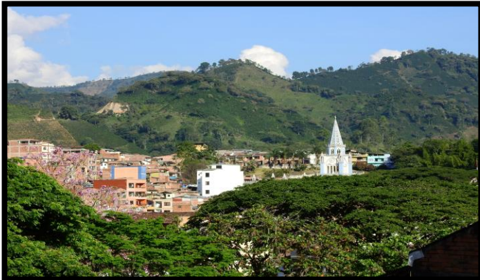
Imagen 1. Panorámicas del municipio de Andes

El esquema de conectividad ecosistémica se deriva de un análisis regional del territorio a escala departamental, presentando una red de conectividades ecosistémicas como conjunto de probabilidades de movilidad de la biodiversidad a través de distintas rutas, que pueden o no coincidir con espacios naturales o antrópicos, que soportan el ordenamiento territorial en términos de oferta y demanda de bienes y servicios ecosistémicos para la población.