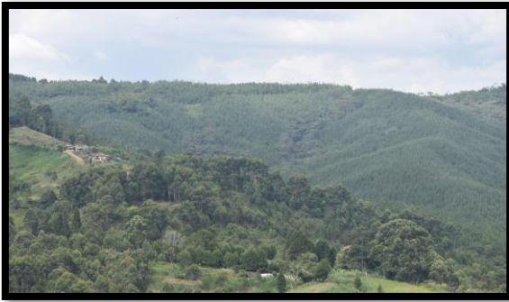
Imagen 1. Panorámicas del municipio de Amagá

El esquema de conectividad ecosistémica se deriva de un análisis regional del territorio a escala departamental, presentando una red de conectividades ecosistémicas como conjunto de probabilidades de movilidad de la biodiversidad a través de distintas rutas, que pueden o no coincidir con espacios naturales o antrópicos, que soportan el ordenamiento territorial en términos de oferta y demanda de bienes y servicios ecosistémicos para la población.