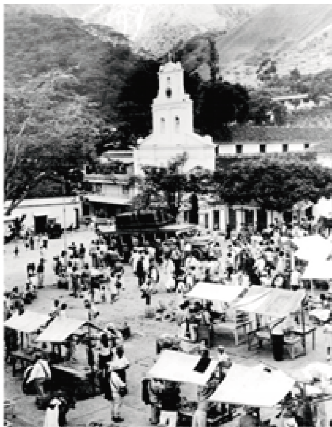
Gabriel Cavajal, Plaza de Heliconia, 1964. https://bibliotecapiloto.janium.net/janium-bin/janium_zui.pl?-jzd=/janium/Fotos/BPP-F-006/0098.jzd&fn=5098

Desde el tiempo en que funcionó como plaza, el Parque “de Bolívar” del Municipio de Heliconia, ha contado con la presencia de árboles; al costado derecho de la iglesia ha tenido representatividad especies vegetales de gran porte y especialmente generadores de sombra, como es el caso del árbol samán, sembrado en el 2003 durante la administración del Alcalde Foción Bedoya, el cual fue sembrado como sustitución a otro de gran porte, el cual con el tiempo vino a consolidar una amplia copa que genera un gran impacto en el paisaje y se volvió un referente para los habitantes del municipio, pues si el sentido de los parques públicos es el encuentro, de ser un punto de llegada, el árbol dentro de este espacio cumple perfecta la función de ser un elemento acogedor, óptimo para la conversa entre amigos, o de gozar de una buena lectura de prensa o de libros, o el de sentir la frescura que emite la sombra que proyecta este majestuoso árbol, que por sus particularidades tanto de estructura como estéticas, lo hace ser un árbol de notable dentro del parque.