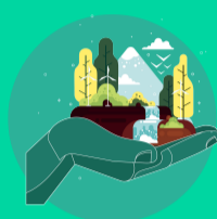
Conservación de la biodiversidad