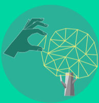
Estructura ecológica principal